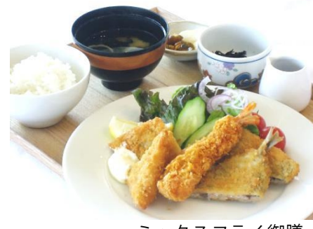
ミックスフライ御膳