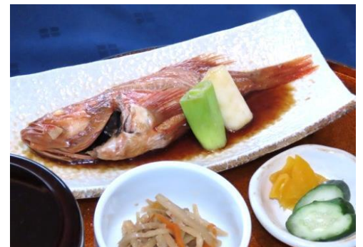
「旬のお魚」御膳 (写真は旬の煮魚)