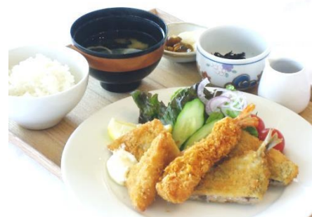
ミックスフライ御膳