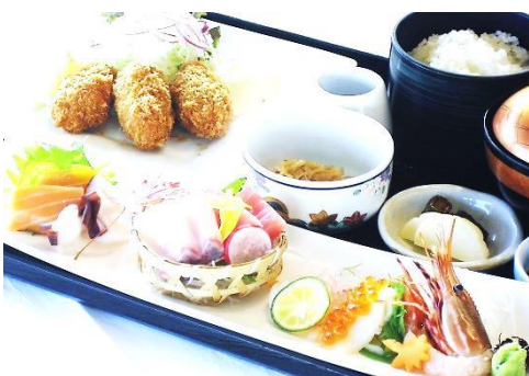
お刺身カキフライ御膳