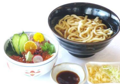
ミニいくら丼と温うどん