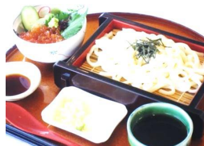
ミニいくら丼とざるうどん