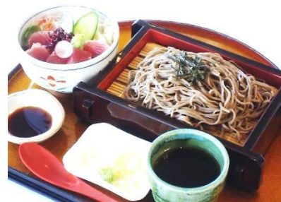
ミニ鉄火丼とざるそば