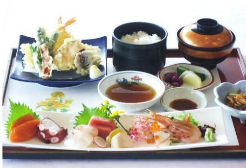
お刺身天ぷら御膳